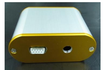
新製品:プラズマモニター